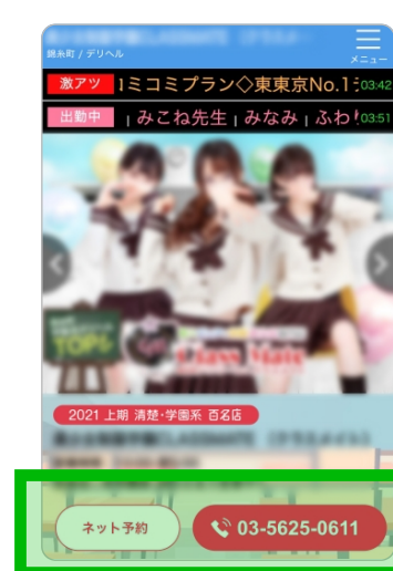
有料掲載 (予約設定済)