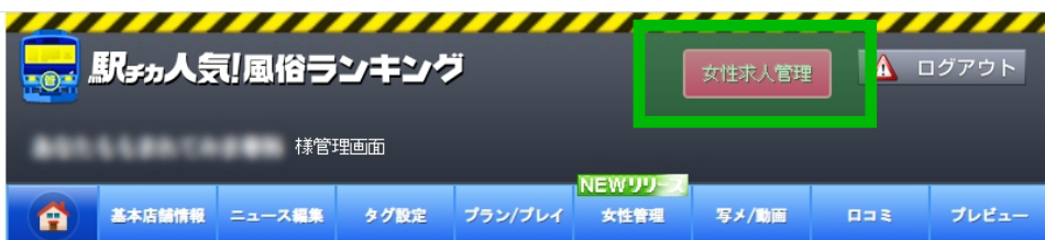
無料掲載の店舗管理