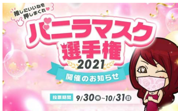
バニラマスク選手権2021