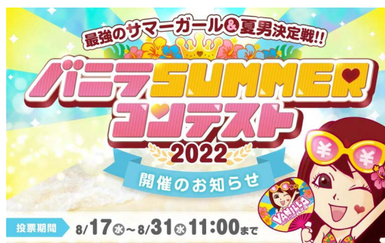
バニラサマーコンテスト2022