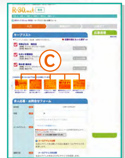
▲ キーリストページ