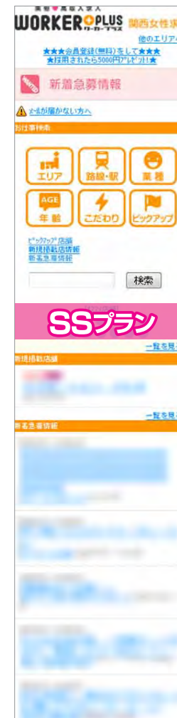
携帯版：トップページ