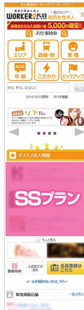
スマートフォン版：トップページ