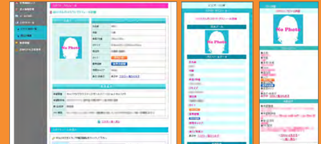
PC版:スカウトページ