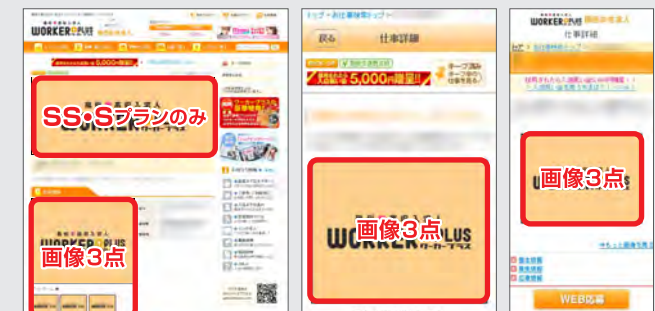
PC版:求人情報ページ

魅力や条件、アピールポイントを自由に表現することができ、工夫するとインパクトのある求人情報になります。