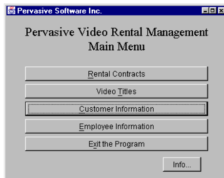
図 1 Zen PVideo サンプル アプリケーションのメイン ウィンドウ - Java