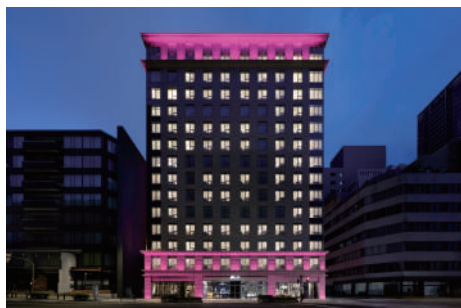
アロフト大阪堂島