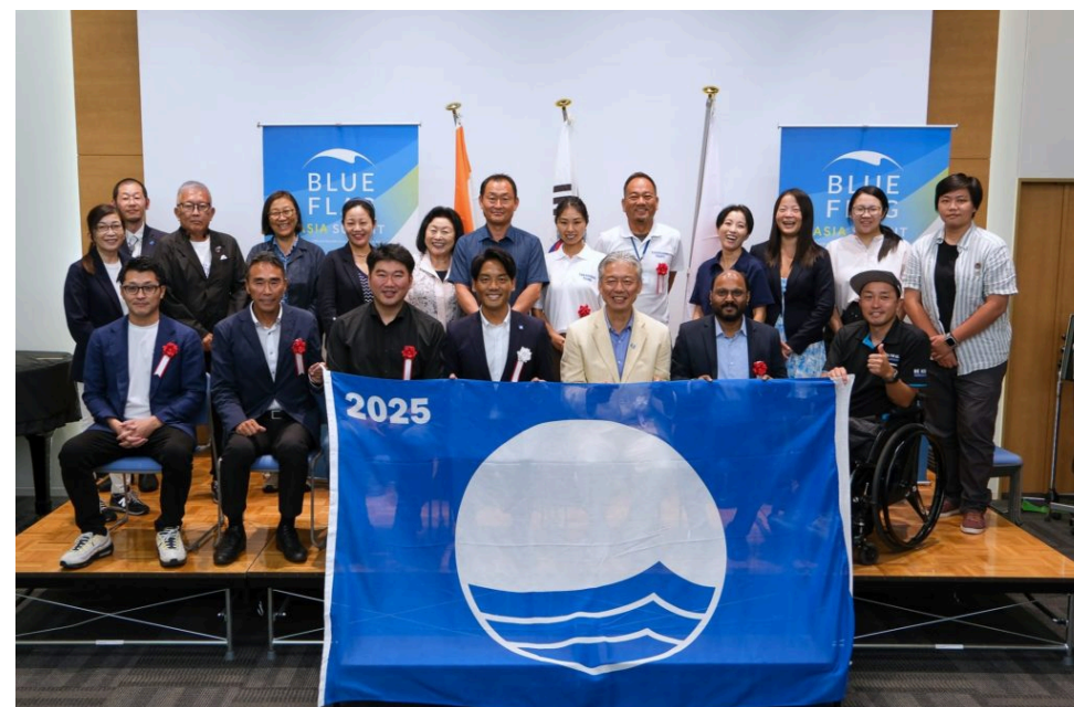
インド、韓国、台湾からの参加者と国内ブルーフラッグ関係者