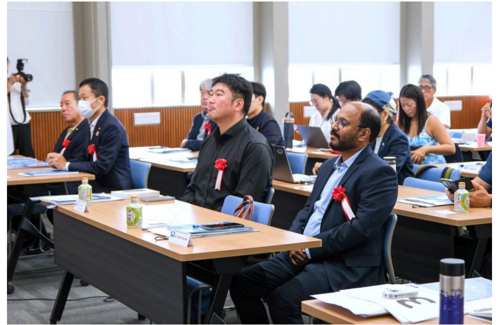
◎ 「二色の浜海水浴場におけるブルーフラッグの取組み」