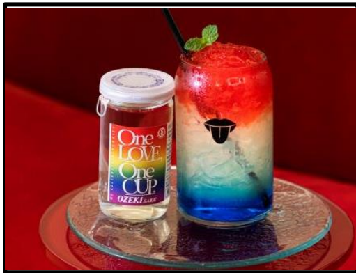
W大阪 レインボーカクテル