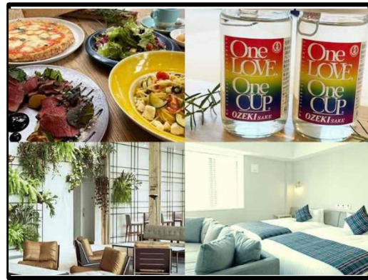
hotel it. osaka shinmachi ワンカップレインボー付ホテルパッケージ販売