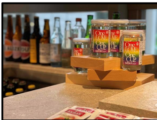
Zentis Osaka ラウンジにあるバーカウンターに設置し販売