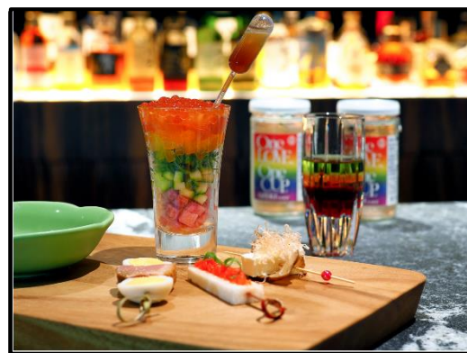
ホテルロイヤルクラシック大阪 レインボーオードブルのパッケージ販売