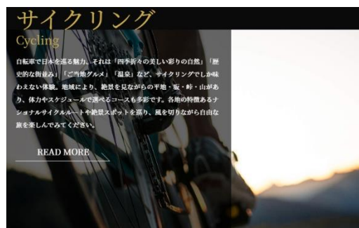
日本の観光ショーケースイメージ