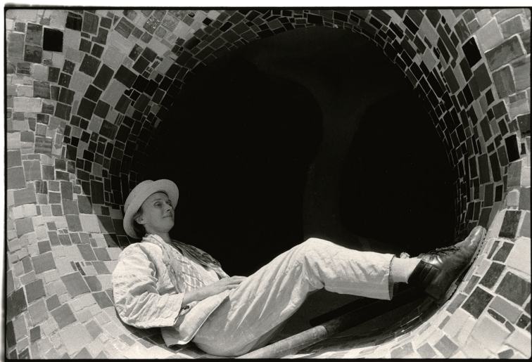
建設中のタロット・ガーデンでつづぐニキ・ド・サンファル イタリア、トスカーナ 1985

20世紀を代表するフランス生まれの造形作家、ニキ・ド・サンファル（1930-2002）。ニキの芸術は、社会の矛盾への怒りをぶつけた射撃絵画、陽気でカラフルな解放された女性像「ナナ」シリーズ、奇想天外な野外彫刻と、自由自在に変化してきた。その集大成がイタリア、トスカーナに20年の歳月をかけて創り上げた彫刻庭園「タロット・ガーデン」。22枚のタロットカードが彫刻や建造物へと姿を変え、誰もが幸せな気分になる空間だ。本作は初期作品から、ニキの終生の夢であった奇跡の庭園、マジカルワールドへの道のりを追う。