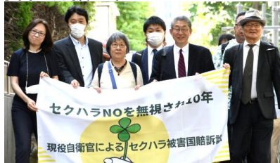
写真: 弁護団(弁護士JPニュース)

※ 期日終了後、東京地裁裏手、弁護士会館1階にて簡単な報告集会を予定。(当日ご案内いたします)