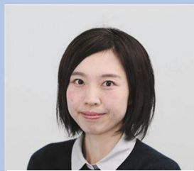
東京新聞 大野暢子記者