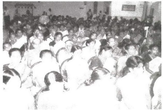
スリランカの家事労働者組合大会(2012. 04. 15)

キャンペーンは、まず多国籍スポーツウェアブランド会社、国際オリンピック委員会、関連する製造業者等に対し、製造現場の労働者の権利を尊重するよう要求しています。同時に消費者に対し、こうした搾取のメカニズムとそこでの労働者の状況を知り、労働者のたたかいに共感と連帯を示してほしいと訴えています。さらに、オリンピック関連商品を作る途上国の実態調査に精力的に取り組んでいます。公式グッズを製造している中国の2つの関連工場の調査概要を紹介します。いずれも、ロンドンオリンピック委員会が定めた労働基準に違反していました（2面に続く）。