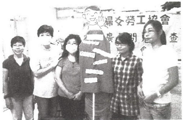
結果報告会 HKWWAの仲間と販売促進員（with マスク）

2010年の3月から7月にかけて、HKWWA（香港女性労働者協会）は、スーパーマーケットの販売促進員（以下、販売員）の状況についての調査を実施した。本調査では、7つのスーパーマーケットの20店舗、138人の販売員へのインタビューができた。調査の結果は、下記の通り販売員の脆弱な状況を示すこととなった。