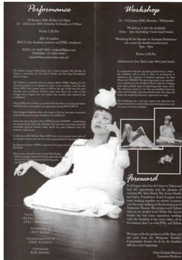
クアラルンプール公演パンフレット (2016年)