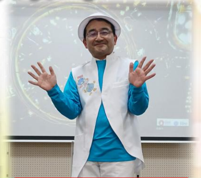
2026プレゼンター衣装 大阪・関西万博風(手作り)