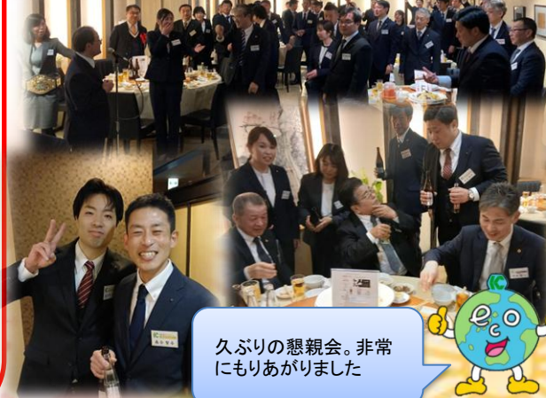
久しぶりの懇親会。非常にありがとうございました