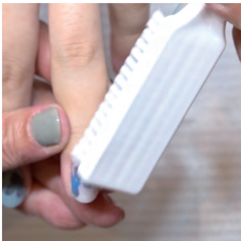
5 指一本ずつにダストブラシをかける。

シルクラップが爪の表面から出ている箇所だけ少しバッフィングするだけでいいです。思い切りしてしまうと、アートがはげてしまったときに取り返しがつかなくなります。仕上げのトップジェルがありますので、ある程度凹凸が残ったとしても、そこでやめておきましょう。