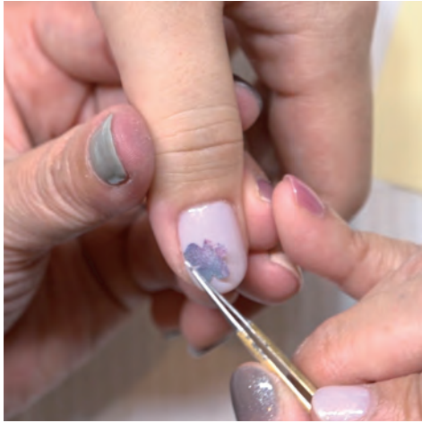
1 切ったシルクラップを爪に貼る。