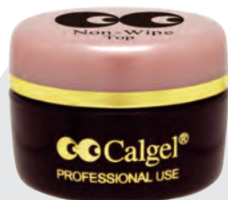
トップジェル (ノンワイプ)