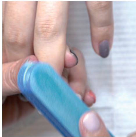
4 軽くバッフィングをする。