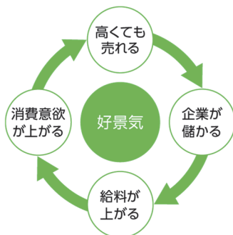
①モノが売れて物価が上がる (デマンドプルインフレ)