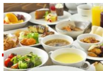
Audreyのランチブッフェ 期間中毎日 11:30～15:00 大人(中学生以上)2,700円 小人(6歳以上)1,500円 幼児(4.5歳)500円 3歳以下は無料

グリルブッフェ&レストラン・バー Audrey (6:30～23:00 火曜日は6:30～19:00) 中国料理 緑花 (11:30～15:00 17:00～21:00)