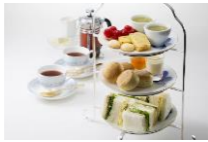
ロビーラウンジ ミザール 「アフタヌーンティーセット」 お一人様1,700円

札幌駅と大通駅を繋ぐ札幌駅前通地下歩行空間直結で、天候に左右されない便利な立地。地産地消をもとに、北海道の大自然が育む恵み豊かな食材を活かした最高の料理でおもてなしいたします。待ち合わせやティータイムにぴったりの広々としたロビーラウンジのほか、大小の個室を備えた西洋料理・中国料理・日本料理レストラン、ビアレストラン、人気のバーでごゆっくりお過ごしください。