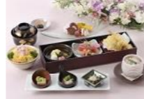
レディースプラン(最大で 11:30～16:30までご利 用可能です。4名様から)

ご好評いただいていますレディースプラン(最大11:30～16:30まで利用可能です。お一人様1杯のソフトドリンクがプランに含まれています)。4種類のプランをご用意しております。お一人様、和食は2,900円、3,600円の2プラン。中華は2,600円。和中華ミックスは2,900円です。予約制となっておりますが、お気軽にお問い合わせ下さい。お仲間とごゆっくり個室でおくつろぎ下さい。