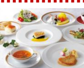
12月のランチコース 全8品3,200円、全7品2,500円 2018年12月1日～12月31 日※日曜を除く

ホテルオークラ札幌のレストランフェア「北海道を食べよう」シリーズ。北海道各地にスポットをあて、各地の美味しい食材や隠された食材、名物料理をオークラの味でご提供。12月は十勝・広尾町の美味を味わう「ひろおサンタランドフェア」、1月は「北海道味紀行～あったかグルメフェア～」を開催。フェアランチは洋食2,500円～、中国料理2,600円～、和食2,100円。