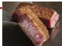
ステーキハウス 桂 「マンズリーディナー」 月替わりで調理長おすすめの食材をお楽しみいただけるコース

札幌市営地下鉄東西線西11丁目駅より徒歩約3分。ホテル・JR札幌駅北口間の無料シャトルバスを運行中。詳しくはWEBで。