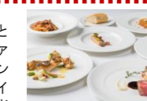
ランチ スペシャル11:30～ 15:00(L.O.14:00) お一人様1,600円 ディナータイム 17:30～21: 30(L.O.20:00)※日～火曜 日は予約制とさせていただきます。

カジュアルな空間でリーズナブルに洋食とワインを楽しめるピストロ「ラ・プロヴァンス」。ランチコースの一番人気は、メインとデザートを選べるプリフィックススタイルの「ランチスペシャル」。じっくりと煮込んだ「牛ほほ肉の赤ワイン煮」、「季節のミックスフライ」、「シーフードドリア」など海の幸や山の幸、約8種類からお選び頂けます。個室もございますのでランチ会にもおすすめです。