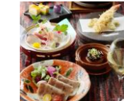
ゴージャスシャンパン付きラ ンチ会席(1月はメニュー名変 更)お一人様 5,400円 2018年12月1日～2019年 12月31日

お祝いレストランとしてもご好評いただいている「日本料理 北乃路(きたのじ)」。個室は全室窓付きで、19階からの眺望を眺めながらお食事をお楽しみいただけます。年末年始のおすすりランチは、食前酒がついた「シャンパン付きランチ会席」全9品。グラスシャンパンの乾杯で始まる華やかなランチは、おしゃべりして出掛けたいお集まりにぴったりです。