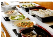
ランチバイキング (毎日開催) 大人1,700円、65歳以上 1,500円、4歳～小学6年生 850円、3歳以下無料

40品もの豊富なメニューが自慢のランチバイキングは毎日開催中です。出来立ての美味しさを楽しめる実演をはじめ、シェフこだわりの料理が90分間お楽しみいただけます。ご家族・ご友人とのお食事はもちろん、カジュアルなご会合や女子会など様々なシーンでご利用ください。フリードリンク付き（提供時間：平日11:30～L.O.14:00、土日祝11:30～L.O.14:30）。