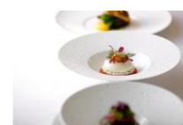
フレンチレストラン 「ミクニ サッポロ」 ミクニランチ お一人様5,000円

フレンチレストラン「ミクニ サッポロ」は、北海道増毛町出身の三國清三シェフがプロデュースするフランス料理店です。JR札幌駅直結の札幌ステラプレイス9階にあり、コンサート前後やお買い物帰りなどに気軽に立ち寄りいただきやすい抜群のロケーション。フランス料理店ならではの落ち着いた店内で、旬の北海道産食材をふんだんに使用したコース料理とワインをご堪能ください。