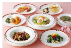
中国料理 桃花林 「楊貴妃ランチ」 (月替わりメニュー) 2,850円 ランチ11:30~L.O.15:00

【中国料理 桃花林】札幌駅から徒歩約15分、大通駅から徒歩1分の好立地。落ち着いた雰囲気の内にて、北海道産食材を積極的に取り入れた広東料理を提供。4月釧路、5月胆振、6月札幌、7月空知フェアを開催。北海道各地の豊かな食材をホテルオークラの味でお楽しみください。楊貴妃ランチ：前菜、スープ、お料理3品、麺飯、デザート 計7品