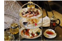
アフタヌーンティーセット 13:00~L.O.17:00 お一人様 2,800円

1階「ザ ロビーラウンジ」では、スイーツとスコーン、サンドイッチなどを三段トレイでお召し上がりいただける「アフタヌーンティーセット」をご提供中。紅茶やコーヒーのフリーフローと共に、優雅な午後のひとときをお過ごしください。