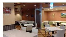
レストランスネービット

(ランチタイム) 和洋中の3セクションから800円・1,000円で提供いたします。※日曜日及び祝日は休業いたします。 (ディナータイム) 令和3年度(令和3年4月1日から令和4年3月31日)は休業させていただきます。