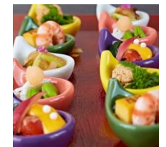
日本料理「随縁亭」お屋のお すすめコース 4,500円 ※写真はイメージです。

ウィーン世紀末をテーマに建設された館内には当時を思わせるアンティーク、絵画が配置され非日常の雰囲気。そのエデルホフ札幌には日本料理のレストラン『随縁亭』を完備。京都の名店で修行を重ねた料理長が腕を振っています。四季折々の新鮮素材を選びすぎり、真の日本の味覚をご堪能いただけます。随縁亭は安心安全を第一に美味しいお料理・快適な空間をご提供いたします。