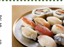
職人が握る生寿司 大人2,200円、65歳以上 1,900円、小学生1,200円、 4~6歳800円

職人が握る生寿司、熱々のグリルメニューを週替わりでご提供。デザート実演コーナーではクロワッサンワッフル等お好みに合わせて仕上げます。スープ、肉料理、魚料理、カレー、中華点心、お惣菜等、和洋中90分食べ放題、ソフトドリンク飲み放題付のランチbuffetです。お一人様からグループまで様々なシーンでご利用いただけます。