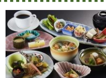
和食御膳 ランチ 1,500円~ ※写真はイメージです。

レストランにおいては、「新北海道スタイル」安心宣言に基づき、お客様の安全・安心を最優先とし広くゆったりとしたお席の配置や利用人数の制限を行います。全てのスタッフはマスクを着用する等、衛生面にも配慮しております。 ランチは月替りで旬の食材を使用したバラエティ溢れる料理をお楽しみいただけます。