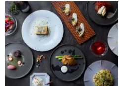
レストラン「LES BOIS」 パスタ1,045円~ スイーツ 880円~ カクテル 880円~

2020年8月オープンのホテル「THE KNOT SAPPORO」はポールタウンと直結しており、地下鉄すすきの駅より徒歩3分の便利な立地。木材と銅色を基調とした2階のレストランは、通り過ぎる路面電車や町中の喧騒を眺めながら、ほっと一息つける癒しの空間。和食の名店『みえ田』監修のメニューはフレンチの中に和のエッセンスが感じられます。食後にはホテルパティシエ手作りのスイーツもおススメです。