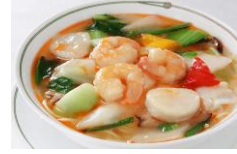
点心とつゆそばのセット ランチ11:50~14:30 (L.O.14:00) お一人様 3,000円

【中国料理 美麗華】天然海老、生ホタテ、イカなどの具材に加え、自家製の海老油を使用した旨味たっぷりの魚介入りあんかけつゆそばです。◆前菜◆点心(小籠包や五目春巻き等から1品チョイス) ◆種類・ご飯類(上記で紹介の魚介入りあんかけつゆそばの他、担々麺や揚州風五目炒飯等から1品チョイス) ◆本日のデザート◆コーヒー又はウーロン茶 ●レストラン利用で駐車場4時間無料です。