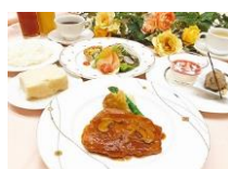
「レストランスピカ」スピカ ランチ:1,000円~ 「赤坂四川飯店」四川三 昧セット:1,700円

「スピカランチ」(11:30~14:00) パスタ・フィッシュ・ミート・カレー・ステーキから一品お選び下さい。スープ・前菜サラダ仕立て・デザート・ドリンクコーナー付き、状況によりスタイルに変更があります。四川飯店ランチタイムおすすめ「四川三昧セット」当店看板メニュー陳麻婆豆腐をはじめ、海老チリ、担担麺の四川料理づくしのぜいたくセットです。