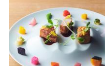
コーススタイルランチ 11:30~15:00(L.O.13:30) お一人様 1,800円~

北海道の季節素材を中心に、フレンチの技術と北海道に息づく食文化をシェフ菅原の感性でアレンジ。目を楽しませる美しくエンターテインメント溢れる盛り付けとともに楽しみいただくランチコースです。シェフこだわり素材のメニューやシェフパティシエが心を込めて作り上げたデザートをお楽しみいただく”デザートギャラリー”など多彩なおブションもご用意いたしました。