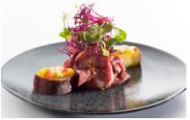
プリフィックスコース 3,850円~ メインのお料理を2品チョイス。オードブル、サラダ、デザートがセットになったおすすめコースです。

道産食材をふんだんに使ったレストランでは、様々なメニューをご用意しております。ディナータイムは、お祝いにぴったりのコースやカジュアルなパーティープラン、ソムリエセレクトのワインをお楽しみいただけます。また、ランチではホテルメイドのお料理をお得にご提供しています！札幌駅から徒歩5分、安心・安全にご利用いただけるホテルポールスター札幌へ、ぜひお越しくださいませ。