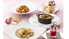
シェフ古川のパスタランチ(通年) お一人様 2,300円 ランチ11:30~14:00 ※店内全席禁煙

道内唯一の回転展望レストラン「ロンド」は、全席窓側・360度の眺望が魅力!北海道産小麦や季節の食材を使用した4種類の Pasta から、1つお選びいただける人気の「パスタランチ」は全5品。アンティパストミスト(前菜盛り合わせ)、サラダ、スープ、デザート、オーガニックコーヒー付。隔月で変更になるパスタの内容はもちろん、期間限定で開催するフェアメニューもお見逃しなく!