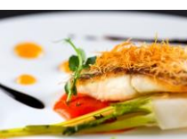
フランス料理「華蘭亭」ランチ タイムのおすすめコース 4,500円 ※写真はイメージです。

創成川を渡り、その先に佇むキングズイローの「ホテルモンテ札幌」。エントランスを抜け、一歩足を踏み入れると近代英国調の異空間が広がる。その2階にフランス料理「華蘭亭」があります。本格的なフレンチコースから、気軽に楽しめるランチコースまで、シェフが手掛ける料理の数々をご用意しております。華蘭亭は安心安全を第一に美味しいお料理・快適な空間をご提供いたします。