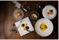
イタリアン居酒屋(バル) 1品 500円~

「バル」とは、ふらりと立ち寄り、気ままにつまみやお酒を愉しむ、イタリア版居酒屋。メニューの大半がワンコイン。前菜から肉料理やパスタなどをご用意しておりますので、アラカルトでのご注文のほか、コース仕立てでも。調理長のおすすめの調理法、季節の食材など工夫を凝らしたバルメニューとご一緒に、土産ワインや地酒などもご用意しております。待ち合せに、ゼロ次会に、ちょっと時間が空いた時にぜひお立ち寄りください。