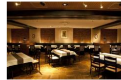
パーティー&ダイニング フォーシーズン ランチメニュー 1,450円~ 11:30~14:00(日・祝日休み)

地下鉄22番出口より徒歩1分のニューオータニイン札幌。シェフこだわりの和食、洋食、中華を楽しめるフォーシーズンやバラエティ豊かなお食事とカフェとしてもご利用可能なランデブーラウンジ。2つのレストランをご用意。またピアノカウンターを中心とした隠れ家的なバーオークルームもございます。お一人様からグループまで幅広いシーンでご利用可能です。