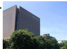
＜最寄り駅からのアクセス＞ 地下鉄「大通駅」1番出口より 徒歩約5分 地下鉄「西11丁目駅」3番出口より 徒歩約3分 市電「西8丁目」停留場より 徒歩約1分

札幌初、富士の溶岩石を使った「武蔵窯(むさしがま)」で焼き上げるグリル料理が人気の「Audrey」と本格中国料理がお手頃価格で楽しめる「緑花」があります。大通公園8丁目に面しており、お食事やティータイムとともに公園の四季折々の景色を眺めることができ、ゆったりお寛ぎいただけます。メニュー内容はホームページもしくはお電話でご確認ください。