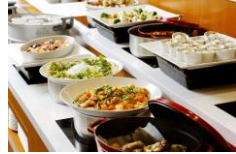
ランチバイキング (毎日開催) 大人2,000円、65歳以上1,600円、4歳~小学6年生1,000円、3歳以下無料

全40品の豊富なメニューが自慢のランチバイキングは毎日開催中です。出来立ての美味しさが自慢の実演メニューやシェフこだわりの季節の料理、パティシエスイーツなどが90分間お楽しみいただけます。ご家族・ご友人とのお食事やカジュアルなご会合、女子会など、様々なシーンでご利用ください。フリードリンク付き。 提供時間：11:30~14:00 (L.O. 13:30)