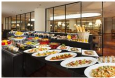
ランチバイキング

ランチバイキング (毎日開催) 新しい時代に、新しいスタイルの美味しさ。旬の味覚が食べ放題。安心してお食事をお楽しみいただくための準備を整え、皆様をお迎えいたします。 11:30~14:30 大人2,700円、65歳以上2,160円、小学生1,350円、4歳~未就学児700円 (事前のご予約をおすすめいたします。)