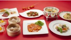
中国料理 芙蓉城 ディナーコース 3,900円~(税込・サ別)

「中国料理 芙蓉城」は、ア・ラ・カルトからコース、食べ放題プランまで、多彩なメニューを揃えた中国料理のレストランです。調理長セレクトの食材で仕上げる四川料理は、辛み、コクなどにこだわった味わいを堪能できます。ご家族でのお集まり、お祝い事にもおすすめです。