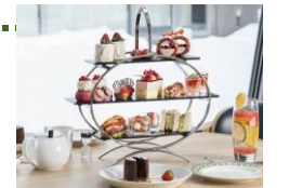
フィーカ アフタヌーンティー 12:00~18:00(L.O.15:00) フリードリンク(ご利用3時間) お一人様 2,700円 ※2日前までのご予約をお願いします。(1日10食限定)

コミュニケーションの時間を大切にお茶とお菓子を楽しむ習慣「FIKA」をコンセプトにしたフィーカカフェラゴム。SATURDAYS CHOCOLATEとコラボしたチョコスイーツや、季節のスイーツをふんだんにパティシエが腕を振るうアフタヌーンティーセットの他、自慢のパンランチ1,485円などの各種ランチをご用意しております。パンのテイクアウトなど、お気軽にお立ち寄りください。