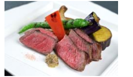
日本料理「和乃八窓庵」 プリフィックス・コース 3,200円 ※季節により料理内容は異なります。 ランチ/11:50~L.O.14:00 席数を限定して営業いたしておりますので、事前のご予約をお勧めいたします。

24階・地上90mの当店の窓から見下ろす中島公園はまるで庭の様。そんな眺望と共に味わえるのは、日本料理を基本としながらも洋食のテーストを取り入れた和モダンな料理の数々。おすすめの「プリフィックス・コース」では、肉料理や魚料理の数種類の中からメインを選べ、前菜や天ぷらに釜炊きご飯、デザートなどついでにボリューム満点。感染症対策を徹底している店内で、安心して優雅な時間をご満喫ください。