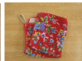
おむつ交換マット 掛けひも付き手ふきタオル