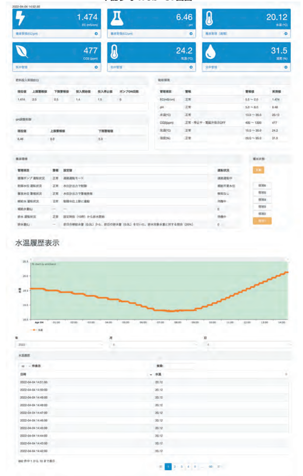
下記参考 Web-UI 画面

溶存酸素量 (DO) 水温 (Th) 酸化還元電位 (ORP) 導電率 (EC) 外部機器稼働監視 等の計測が行えます。