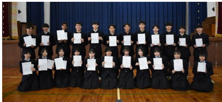
男女総合10位までの入賞者及び各班1位の選手