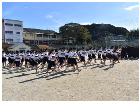
女子スタートの様子