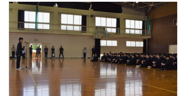
常任委員長からの歓迎のことば

14日(月)の午後には、1年生と上級生(2・3年生)が一堂に会し、対面式が行われました。生徒会常任委員長(生徒会長)と新入生代表生徒それぞれからメッセージが伝えられた後、本校の応援団によって新入生歓迎の演舞が披露されました。体育館に入場する際には緊張した面持ちだった1年生の皆さんは、対面式が終わる頃にはリラックスした様子でした。