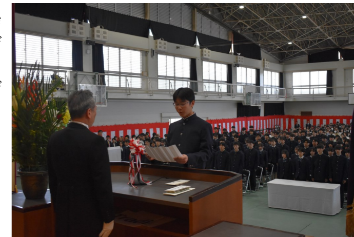
新入生代表生徒による宣誓