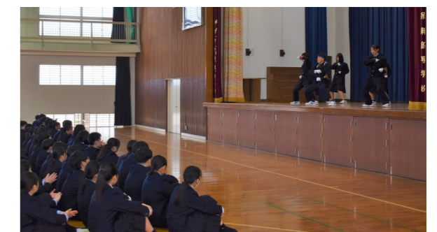
応援団による演舞の披露