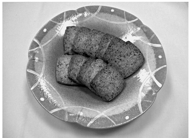
「じゃこてんビスケット」(浅田 康路)