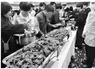
ご当地グルメブースには長蛇の列

テやいくら、長いも、しじみ汁、網走ちゃんぼん、でんぶん団子のほか、航空自衛隊網走分屯基地のご当地グルメ「空自空上げ(からあげ)」など、オホーツクならではの食材や料理が並び、参加者は地域自慢の味覚を堪能しました。 また、YOSAKOIソーラン部による演舞や東京農業大学全学応援団によるパフォーマンスも披露され、会場は大いに盛り上がりました。 新入生や保護者は地域住民との交流を通じて網走への理解を深めるとともに、新生活への期待を膨らませていました。