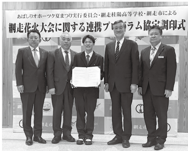
網走花火連携プログラム協定を締結した関係者ら