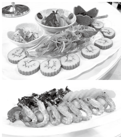
お正月らしい華やかな料理

新たな挑戦や人材が生まれる環境づくりを進めていく考えを示しました。 その後、来賓から祝辞が述べられ、乾杯の発声により懇談が始まり、新年恒例の餅つきも行われ会場は大いに盛り上がりを見せました。 出席者は料理を囲みながら意見交換や歓談を行い、親睦を深めるとともに、新たな一年の門出を感じさせる有意義なひとときとなりました。 会員事業所の皆様におかれましては、本年も何卒よろしくお願いいたします。