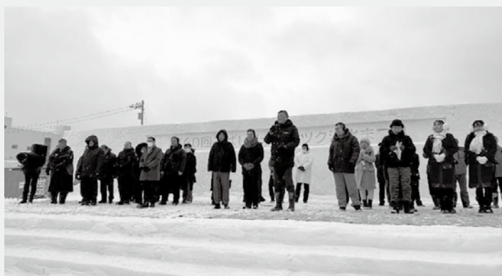
昨年の流氷まつり開会式の様子