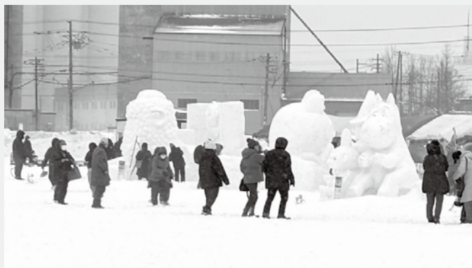
雪像や氷像が並ぶ会場

今月、第61回目を迎える網走の冬の風物詩「あばしりオホーツク流氷まつり」が開催されます。オホーツク海に浮かぶ流氷を背景に、市民や各団体が手がけた美しい氷雪像が会場を彩ります。今年も幻想的な雰囲気の中で冬の網走を存分に楽しめるイベントが盛りだくさんです。