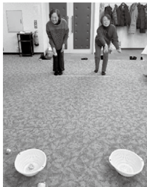
大盛況のざるゲーム