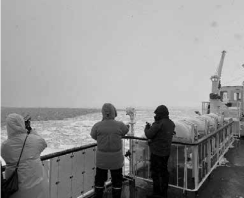
季節外れの流氷がびっしり

今回は、網走の冬を代表する観光体験として、流水観光砕氷船「おーら」に乗船しました。