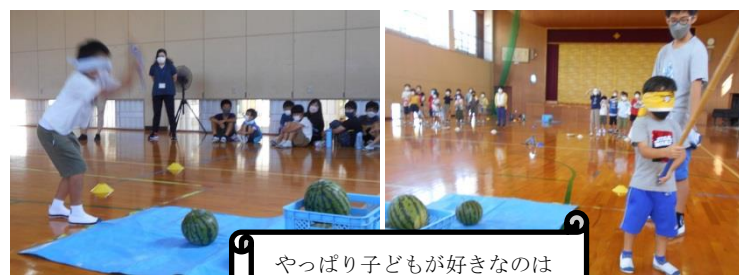
やっぱり子どもが好きなのは 時間割より スイカ割り

今のご時勢、大勢の人が集まるにぎやかな場所での楽しいイベント等への参加も我慢し、家でおとなしくしている子どもたちも多いのではという思いもあり、夏休みの楽しい思い出のひとつになればと、考えられた独自企画です。初体験の児童も多く、周りからの声に右往左往戸惑いながらも、わくわくドキドキの楽しいひとときをすごしました。（緊張のせいか、右と左が分からなくなってしまう子が多かった～）用意したスイカは、ご家族でスイカを生産している本校職員からスイカ割り用にわけてもらったものです。密を避けるなど、感染対策に留意して実施したため、思いのほか時間がかかり、予定終了時刻をオーバーしてしまいました。最後に、割ったスイカの代わりとして、冷たい”スイカバー”を美味しそうにペロリと食べて帰りました。