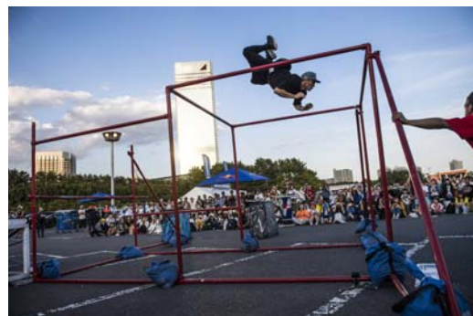
パルクール(ジェイソン・ポール 他)