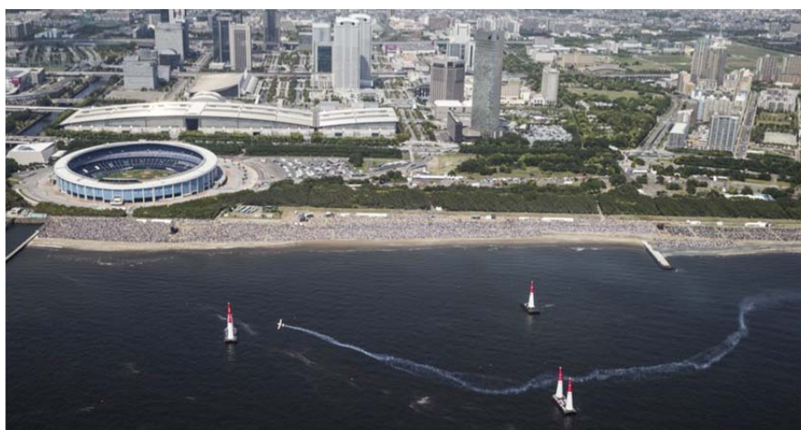
大勢の観客で埋め尽くされる千葉大会