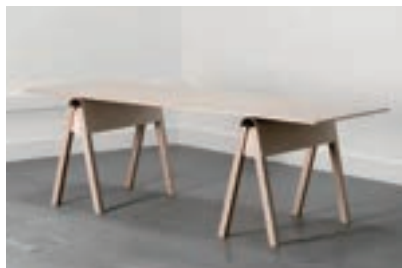
テーブル 6 脚 (180x90)