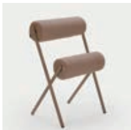
ロールチェア 18 脚