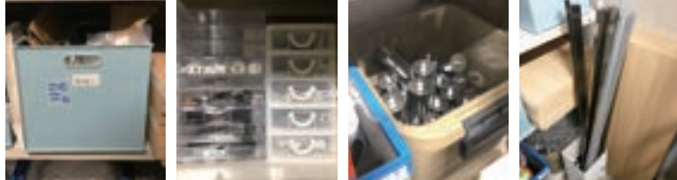
ワイヤー収納BOX フック収納BOX(右) 重石収納BOX バー、棚板収納エリア