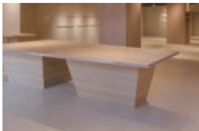
テーブル 1 脚 (360x170)