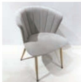
ソファア椅子 11 脚 (一部例)

プロジェクター、マイク (1 本)、音響システム (Bluetooth 対応)、Wi-Fi、ハンガーラック、フィッティングルーム、ピクチャーワイヤー、スタンド看板 (A4)、傘立て、姿見、キッチン設備、お荷物受取・発送 (同時予約がない場合のみご対応可能)