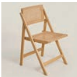
ウッドチェア 16 脚