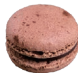
Chocolate ショコラ ¥430

フランボワーズのガナッシュにグロゼイユ、カシス、フリーズデボワのコンフィチュール。当店人気のドリンクをマカロンにアレンジ。