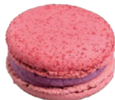
Berry berry ベリーベリー ¥430

フルーティで甘酸っぱいカシスのクリーム。パイオレットカラーが可愛いさっぱりとしたマカロンです。