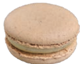
Vanille バニエユ ¥430

マダガスカル産バニラを贅沢に使用したこちらは、一口頬張るだけで至福のひと時を味わえます。