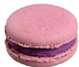
Cassis カシス ¥430

マダガスカル産バニラを贅沢に使用したこちらは、一口頬張るだけで至福のひと時を味わえます。